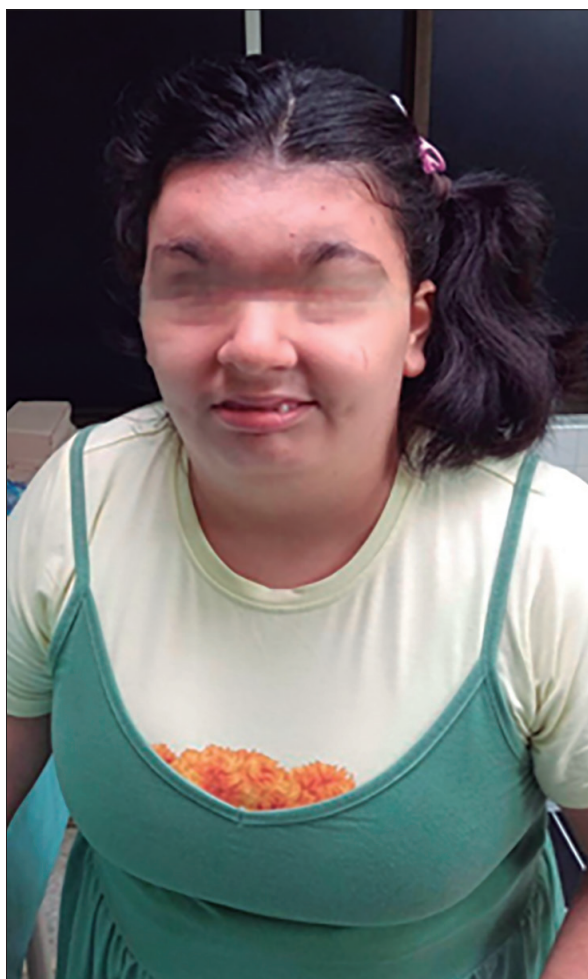
Imagen 1. Presencia de micrognatia e hipertelorismo.

pueden desencadenar una sobreexpresión de proteínas que favorecen la lipogénesis y una disminución de las que participan en la lipólisis. Este desajuste puede alterar el equilibrio entre estos procesos, resultando en una acumulación excesiva de lípidos en los hepatocitos y, por consiguiente, en el desarrollo de esteatosis hepática. Este fenómeno se debe a una incapacidad del hígado para metabolizar los ácidos grasos de manera eficiente, lo que lleva a una alteración en la homeostasis lipídica y puede manifestarse clínicamente como una acumulación de grasa en el hígado. 5,6