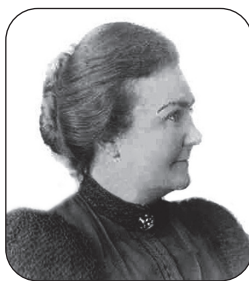
Dra Cecilia Grierson

Expresidentas de la Sociedad Argentina de Historia de la Medicina, AMA. Correo electrónico: inesbores1@gmail.com