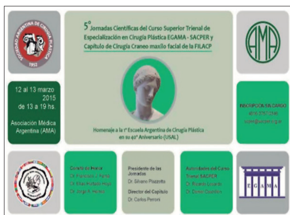
Figura 2b. Tapa del programa de las jornadas, realizadas en la AMA, donde figura el homenaje al 40° Aniversario de la primera Escuela Argentina de Cirugía Plástica.