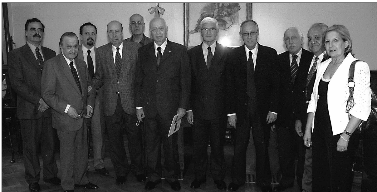
Jornadas AMFA-CECTAF en Buenos Aires, 2013. Firma Acuerdo de trabajo AMA-AMFA-CECTAF. Presidentes y comisiones directivas de las tres instituciones.