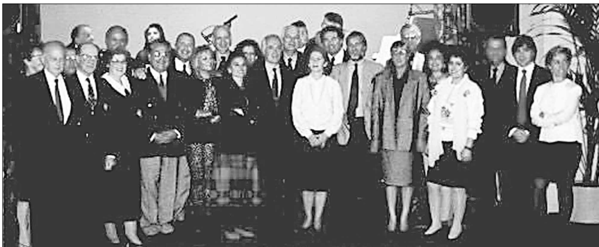
Un grupo de asistentes a la Tercera Jornada de AMFA, en Toulouse, octubre de 1992.