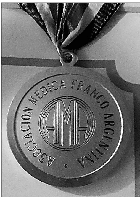
Medalla de Oro de la AMFA para los Miembros de Honor, entregada en el 2005.