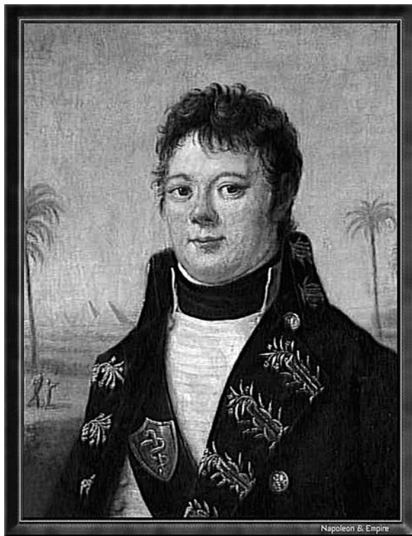
Figura 2. René Nicolas Dufriche Desgenettes (por Antoine François Callet).

Jean Pelletan (1747-1829) y Félix Vicq-d'Azyr (1746-1794), y en Londres con John Hunter (1728-1793). Durante cuatro años hizo varios viajes de perfeccionamiento por Inglaterra e Italia. En 1789, el año de la Revolución, obtuvo su doctorado en la prestigiosa Universidad de Montpellier con una tesis acerca de los vasos linfáticos. Por consejo de su antiguo maestro Vicq-d'Azyr e impulsado por un deseo de servir a su patria se alistó como cirujano en el ejército en la frontera con Italia en febrero de 1793. Pronto se convirtió en uno de los cirujanos del ejército gracias a su energía y a su valor, y en marzo de 1793 fue adjunto al hospital de campaña del ejército en el Mediterráneo gracias a su conocimiento del italiano. Allí deslumbró a Napoleón, quien lo hizo Médico en Jefe de la Expedición a Egipto.