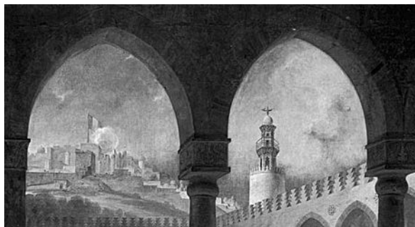
Figura 5. Detalle de "Bonaparte visitando a los apestados de Jaffa" (Antoine Jean Gros, 1804).

A la izquierda se observa una decoración típicamente árabe. Hay un hombre rico vestido con ropas orientales que ofrece pan a unas manos extendidas. Detrás de él hay un sirviente con una canasta llena de pan. Detrás de ellos, dos hombres negros llevan una camilla, sobre la cual, aparentemente, hay un cadáver (Figura 6). La arcada de dos colores se abre a una galería llena de enfermos.