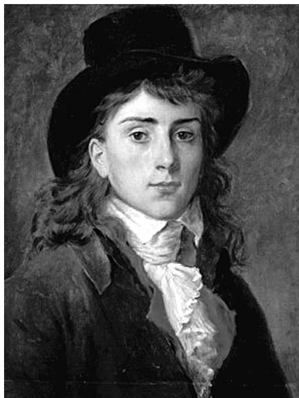
Figura 3. Antoine Jean Gros a los 20 años (Francois Gerard, 1791).

Antoine Gros era hijo de un conocido pintor de miniaturas que le empezó a enseñar a dibujar a la edad de seis años, época en la que ya mostraba dotes de un gran maestro. En 1785 ingresó a pintar en el estudio del pintor neoclásico Jacques Louis David (1748-1825).