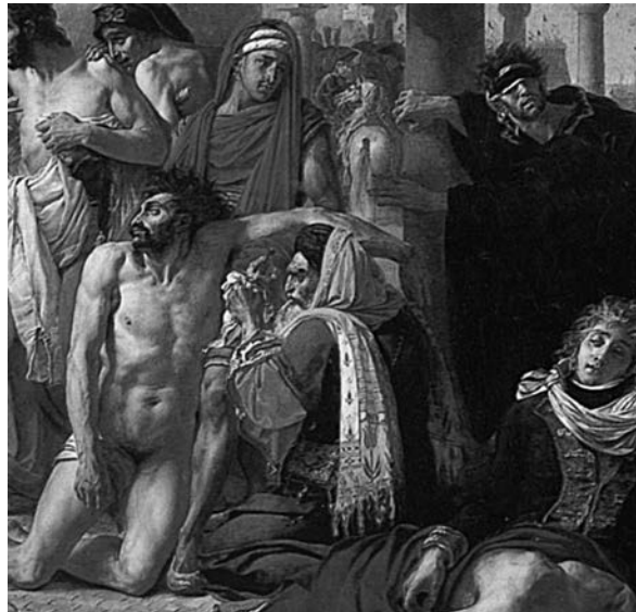
Figura 8. Detalle de “Bonaparte visitando a los apestados de Jaffa” (Antoine Jean Gros, 1804).

noció a Gros. Consultado sobre el hecho y su venganza, el pintor confesó: “Para defenderse de un insulto el portero tiene sus puños, el oficial tiene su espada, el escritor tiene su pluma, y el pintor tiene su pincel.”